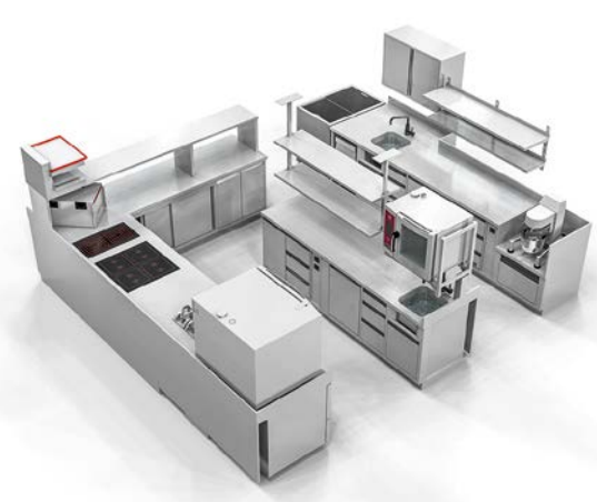
Une organisation optimale grâce aux cuisines compactes.