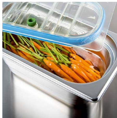
«freeze'n'go», la méthode révolutionnaire de production.