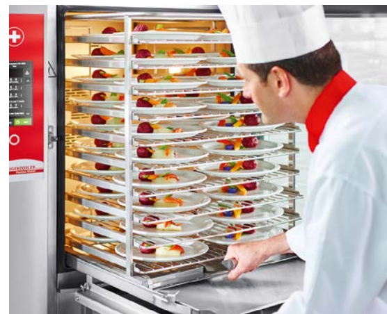
Des résultats de régénération optimum avec les systèmes de cuisson suisses.