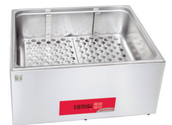
Grill de protection (de série)