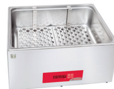
Grill de protection (de série)