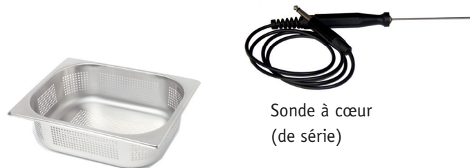
Recipient perforé (accessoires)