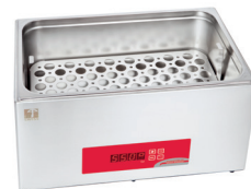
Grill de protection (de série)