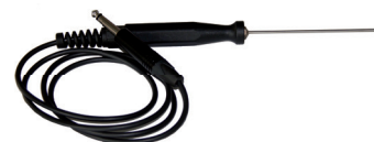
Sonde à coeur (de série)