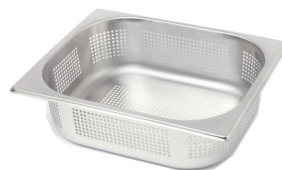
Recipient perforé (accessoires)